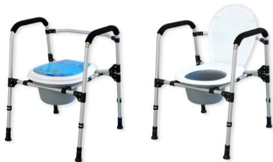
Fot. 1. Krzesła sedesowe nieskładane

Krzeseła mają możliwość skokowej regulacji wysokości co 20 mm (min. wys. 410 mm, max. 560 mm) poprzez wysunięcie rurek regulacyjnych z korpusu i blokowaniu ich zatrzaskiem wpasowanym w otwory znajdujące się w rurkach. Dwa zestawy otworów pod zatrzask czynią dwukrotnie większy zakres regulacji.