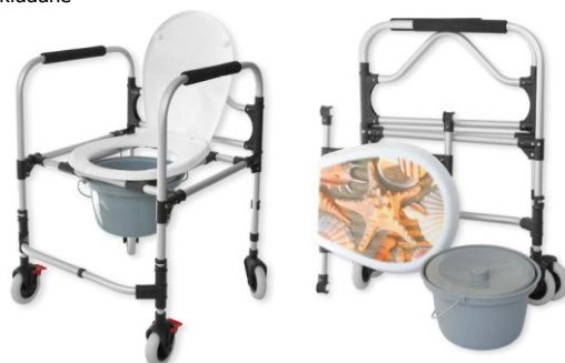
Fot. 2. Krzesła sedesowe składane